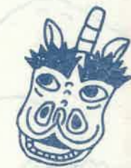
多加牟久神社 (鹿野・本角) 10月1日 前後の土曜日

神楽獅子は別名「唐獅子」ともいわれ、ライオンあるいは狛犬のようにずんぐりとした顔をしています。頭には両耳が垂れ下がっておりこれが動くようになっているのが最大の特徴です。「蚊帳」は麻織・藍染の地に打ち出の小槌や牡丹の花柄など様々な縁起物を描いた図柄が数多くあります。