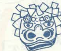
小原神社 (小河内) 10月第4日曜