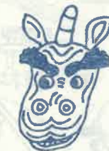
弓河内神社 10月第2日曜