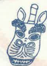
中井神社 10月第2土曜