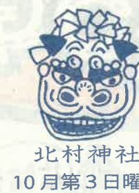
北村神社 10月第3日曜

西郷地区では、6集落で麒麟獅子、2集落で神楽獅子が今なお受け継がれています。例大祭では神社に本舞が奉納された後、各家々を回り獅子頭が子ども、お年寄りの頭を「咬む」風習も残っており獅子に頭を咬んでもらった子どもは賢く育ち、お年寄りには長生きできるとされています。