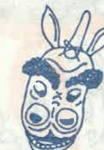
小畑神社 10月第1日曜