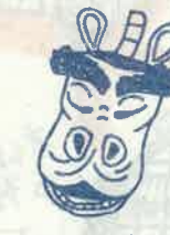
神馬神社 10月第4土曜