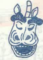
牛戸神社 10月体育の日