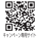
キャンペーン専用サイト

ひよんなこと!?! がきっかけで、鳥取市にやってきたばかりの「風変わった外国人キャラクター」トットリー氏の目線で、ちょっとユニークな鳥取市の魅力探しが始まります。 来月からは、市報のなかでも本市インスタグラムと連携して、市内の素敵な写真を紹介していきます。みなさん、トットリー氏の活躍に、乞うご期待。