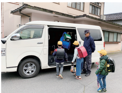
民間バス路線「横枕線」の廃止に伴い導入された「大和ふれあいタクシー」

問い合わせ先 本庁舎交通政策課 TEL 0857-22-8111 FAX 0857-20-3040