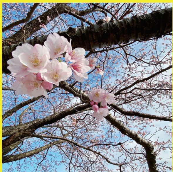
湖山池青島 オオカンザクラ