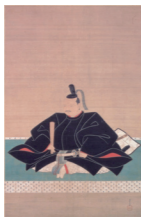
吉川元春画像(吉川史料館蔵)

鳥取市と岩国市の姉妹都市提携 25周年を記念し、吉川史料館の協力のもと、吉川史料館の名品の数々を紹介。