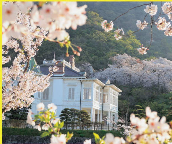
鳥取城跡 桜と仁風閣