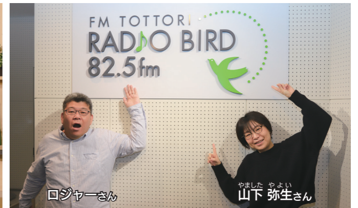
FM鳥取パーソナリティの2人

災害時にも迅速な情報発信 市役所と2つのスタジオとの連携は、災害などの緊急時にも力を発揮します。 近年、大雨による災害などが頻発し、市内各地区の避難情報などの災害情報をスピーディに発信しなければならぬ場面が増加しています。そのような状況下で、防災の拠点である市役所庁舎の隣にスタジオがあることで、距離の近さを生かした迅速な情報発信を行うことができず。災害時にはFM鳥取の緊急割り込み放送、いなばぴよんぴよんネットのL字放送などで市内の緊急情報を速やかに発信します。 また、市長や市の担当者が直接スタジオから情報発信を行うこともできます。今年には新型コロナウイルス感染症の影響で、市内でも不安やうわさが蔓延する中、市長自らがスタジオで市民のみなさんへ感染防止や誹謗中傷を防止する呼びかけを収録し、FM鳥取といなばぴよんぴよんネットで放送しています。