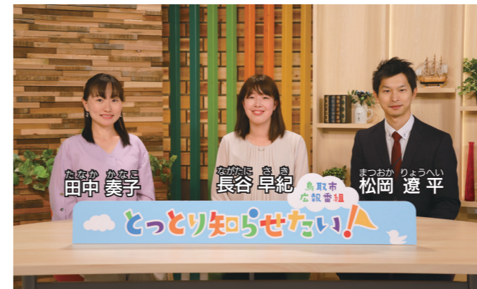
鳥取市広報番組「とっとり知らせたい！」キャスターの3人