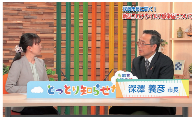
市長自らが番組出演して注意などを呼びかける