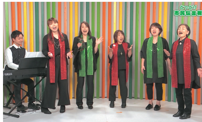
市内の団体が活動紹介やイベント告知などを行う番組も放送