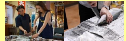
海側での体験商品(魚さばき)