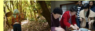
山側での体験商品(収穫～調理～食)