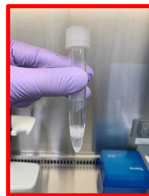
泡が多い 十分量採取されていない