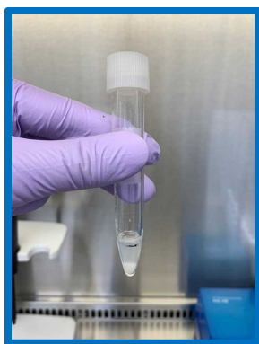
泡が少ない 十分量採取されている