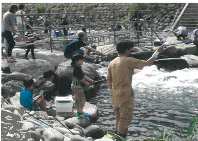
国府フィッシングフェスタ