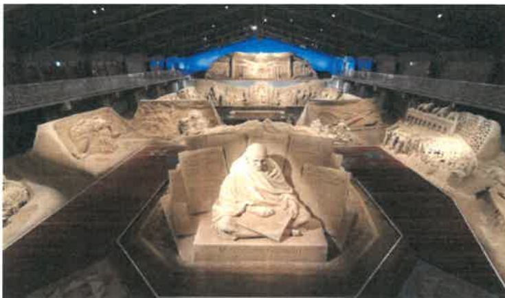
鳥取砂丘砂の美術館