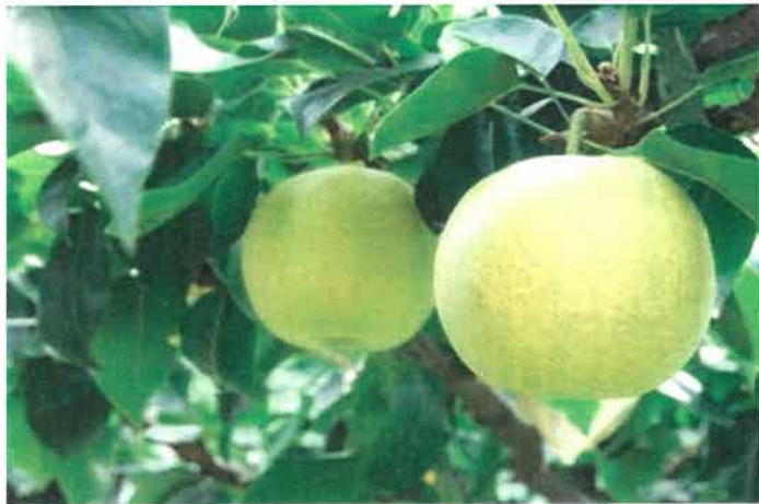
鳥取すごい！ライド