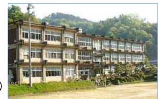
廃校の有効活用 (画像は旧神戸小学校)