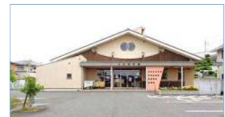
保育園の民営化 (画像は大正保育園)