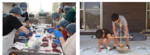
若者の参画事業（画像は成器地区：「いただきます」の食育事業）