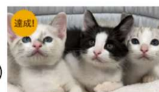
クラウドファンディング活用 （画像は野良猫の不妊・去勢手術補助事業への寄附募集）