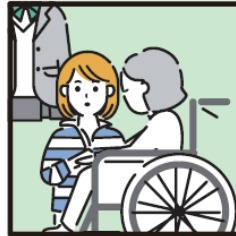
障がいや病気のあるきょうだいの世話や見守りをしている。