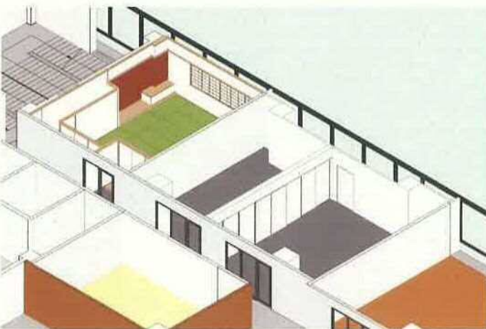
イメージ図③（和室と研修室）（閉鎖時）