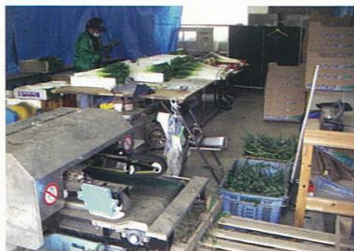
農機具庫・作業スペース