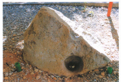
骨蔵器を納められていた石ふた

因幡国の豪族の娘で文武天皇に仕えた采女の墓です。死後火葬にされ、銅製の骨蔵器に入れられて郷里に葬られましたが、全国でも10数例しかない貴重なものです。【骨蔵器 国指定重要文化財 墓跡国指定史跡】