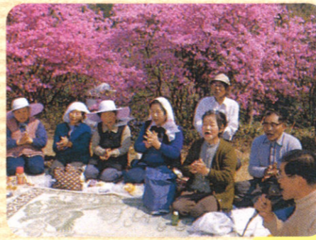
一の谷公園つつじ花見

4 お茶屋本陣跡 お茶屋とは、大名の宿泊または休憩に使われた場所で、瀬戸川に面したこの辺りには、山奉行の居所ならびに馬18頭を収容できる馬小屋があった。