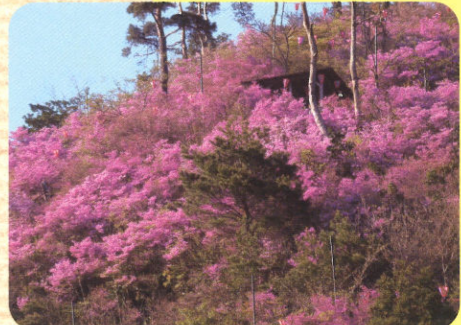
愛宕山公園のみつばつつじ

3 松尾芭蕉句碑 芭蕉は山陰には来遊していないが、翁の俳風を偲んで建てられた碑は多い。用瀬の芭蕉碑は俳句を刻んだものとしては因幡地方で最も古い。