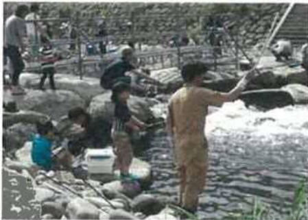
国府フィッシングフェスタ