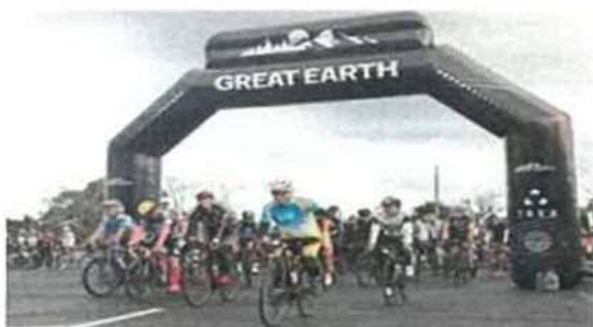
鳥取すごい！ライド