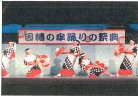
因幡の傘踊りの祭典