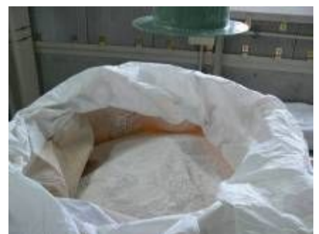
試験稼働で回収されたリン酸塩