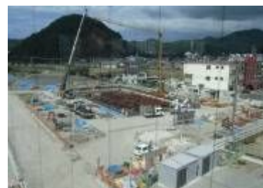
建設が進む秋里雨水ポンプ場

平成16年から進めている、合流式下水道緊急改善事業の最後を締めくくる「秋里雨水ポンプ場」が今年度末に竣工します。この施設の完成により、放流水質の改善や浸水を防ぐことが期待できます。