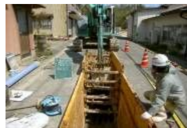
下水道の新設工事(布勢地内)

市内の公共下水道施設から発生する沈砂を収集し、洗浄の集約処理を行う施設が、今年度末に完成します。洗浄された砂は、再生砂として再利用する予定です。