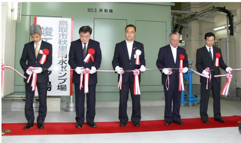
テープカットによりポンプ場の完成を祝う

放流水質の改善や浸水被害の軽減などを目的に鳥取市が整備してきた秋里雨水ポンプ場が完成し、竣工式が5月9日、鳥取市秋里の現地で行われました。