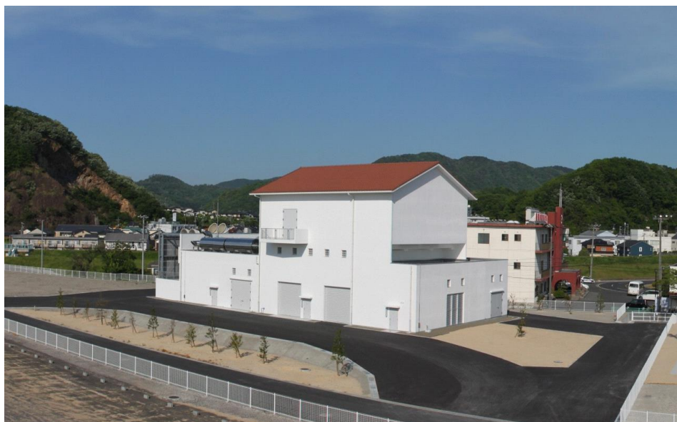
完成した秋里雨水ポンプ場

施設の管理は、鳥取市が取り組んでいる下水道等包括的管理委託により(公財)環境事業公社へ委託しています。