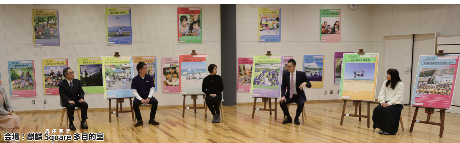
会場：麒麟 Square 多目的室