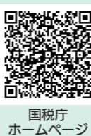
国税庁ホームページ