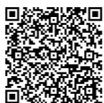
住民税申告書作成・試算システム

※住民税申告書作成・試算システムは1月中旬運用開始予定です。詳しくは市民税課へお問い合わせください。