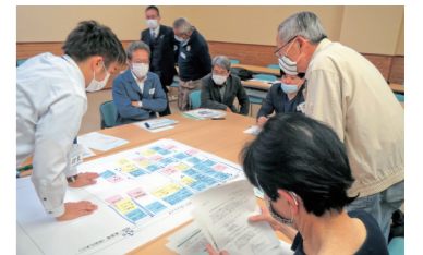
市民ワークショップ

跡地に求められる機能について、各種団体との意見交換会、市民ワークショップ、大学生や高校生などを対象としたストリートミーティングなどを実施しご意見を伺いました。各種団体との意見交換会には10団体、2回開催したワークショップと4回開催したストリートミーティングには合わせて70人以上が参加するなど、多くのご意見をお寄せいただきました。