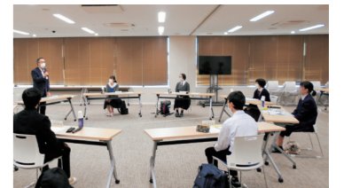
高校生とのストリートミーティング

今後、本庁舎跡地に「求められる機能」について、これまでの意見を整理するとともに、市民アンケートを実施します。