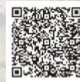
YouTube「鳥取市公式動画チャンネル」