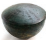
伊福吉部徳足比賣骨蔵器(複製)

万葉集の写本(複製)をはじめ、文字資料の見方や資料から何が分かるのかなどを紹介。 とき 7月31日(土)～ 8月29日(日) 観覧料 無料 ※要入館料