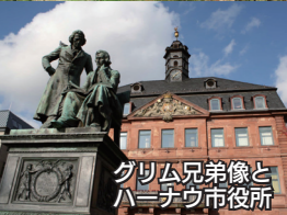
グリム兄弟像とハーナウ市役所

ドイツ連邦共和国のヘッセン州に属し、フランクフルトから東へ 20 キロメートルに位置する商工業が盛んな都市です。赤ずきんちゃんや白雪姫に代表される「グリム童話」の作者グリム兄弟生誕の地としても知られ、「ドイツ・メルヘン街道」の出发点となっています。