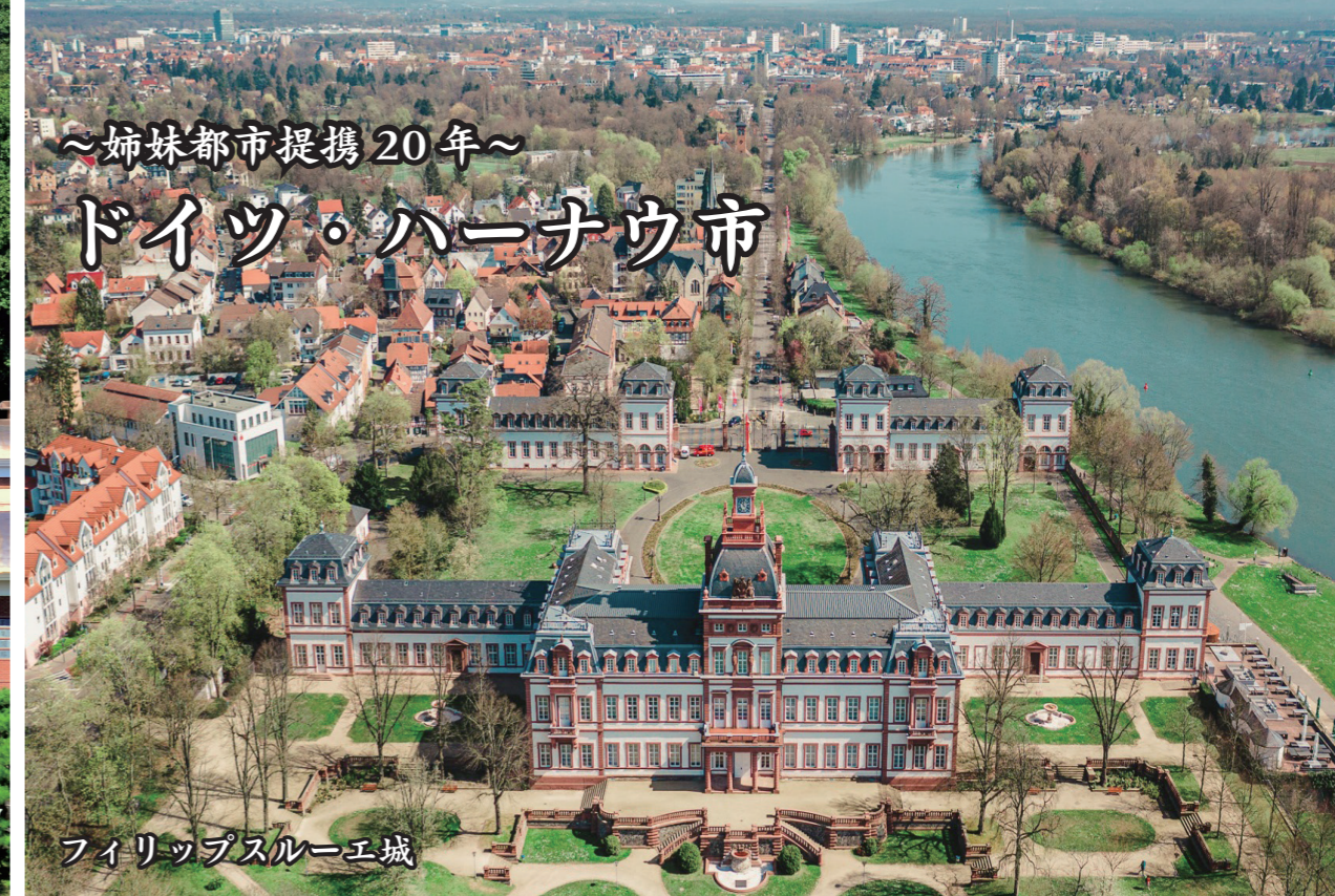
フィリップスルーエ城

ドイツ連邦共和国のヘッセン州に属し、フランクフルトから東へ 20 キロメートルに位置する商工業が盛んな都市です。赤ずきんちゃんや白雪姫に代表される「グリム童話」の作者グリム兄弟生誕の地としても知られ、「ドイツ・メルヘン街道」の出发点となっています。