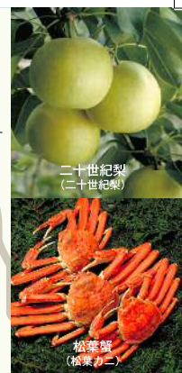
二十世紀梨 (二十世紀梨)