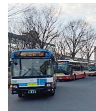
路線を維持するためにも積極的な利用を

鉄道や路線バス、タクシーなどの地域公共交通の利用者数は、人口減少や、自家用車を中心としたライフスタイルの拡大により減少傾向が続き、その維持・確保が困難な状況となっています。さらに、下のグラフが示すように路線バスの経営は、令和2年以降は新型コロナウイルス感染症拡大の影響を受け利用者数が大幅に減少し、危機的な状況です。また、全国的にもバスやタクシー事業者の倒産や事業縮小が続いています。