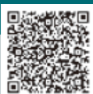
3回目接種について

3回目接種券がお手元に届いた人は、接種券に記載の日付にかかわらず、2回目接種から6カ月経過していれば接種が可能です。