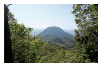
太閤ヶ平から久松山を望む