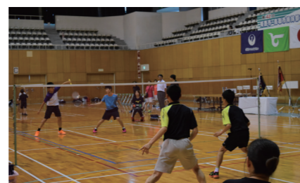
親善スポーツ交歓大会(昭和52年から毎年実施)

これまでの交流事業は？ 姫路お城まつりや鳥取しゃんしゃん祭などを通じた観光交流、幅広い世代の市民が参加する親善スポーツ交歓大会、中学生が合宿を通じて交流する中学生合宿交歓会、市議会や経済団体との交流など、さまざまな分野で交流を深めてきました。