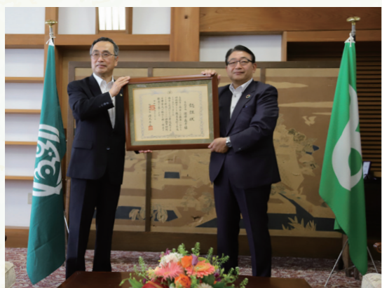
特別名誉市民称号の認証状とともに記念撮影する深澤市長と清元市長

令和4年5月21日、深澤義彦市長が、姫路市の清元秀泰市長から特別名誉市民称号を授与されました。この称号は、親善その他の目的で姫路市の賓客として来訪した姉妹都市の代表者に贈られるものです。