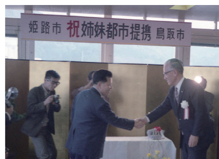
姉妹都市提携調印式(昭和47年3月8日)

われていきます。現在復元が構想される二ノ丸三階櫓は、姫路城の大手守を築いた職人らが鳥取へ移った後に築いたものと伝えられています。鳥取城は姫路城との歴史的つながりの象徴ともいえる存在です。これらのつながりをふまえ、昭和47年3月8日に姉妹都市提携し、今年で50周年を迎えます。