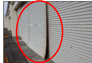
鳥取市B&G海洋センター ※艇庫のシャッターが破損