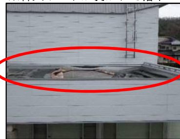
若葉台体育館 ※防水シート剥がれた