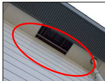
富桑体育館 ※軒天ボードが剥がれて落下