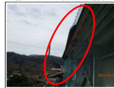
日置体育館 ※庇（ひさし）が剥がれて落下