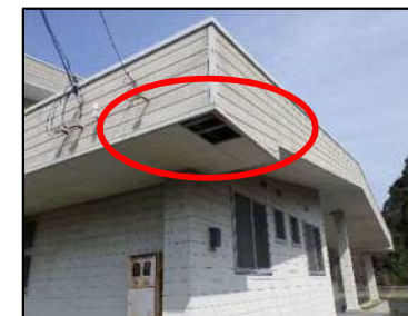
東郷体育館 ※軒天ボードが剥がれて落下