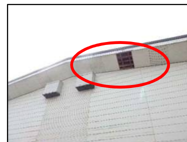
末恒体育館 ※軒天ボードが剥がれて落下