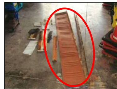
旧福部町武道館 ※屋根の一部が剥がれて落下