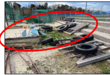
気高町運動広場 ※ダッグアウトが全壊した