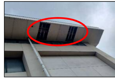
気高町農業者トレーニングセンター ※軒天ボードが剥がれて落下