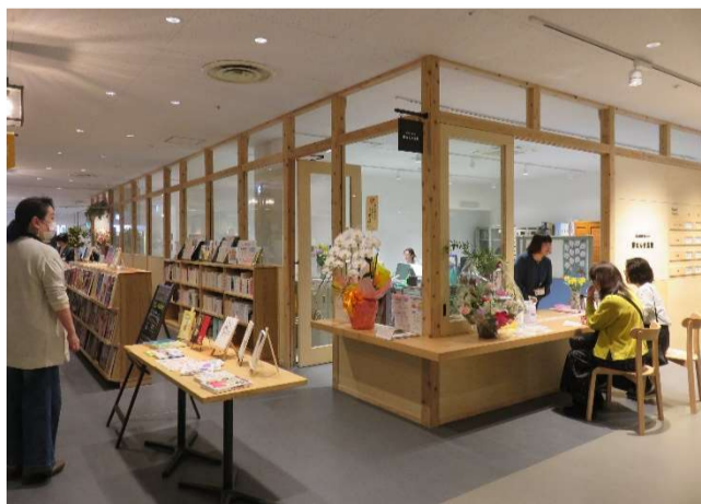
センター執務室前