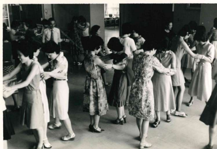
社交ダンスの基礎講座（昭和50年7月）