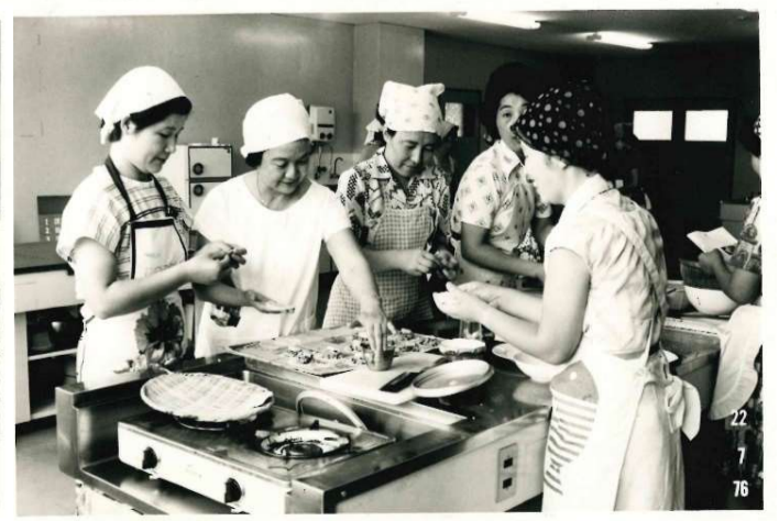
さざんかグループの料理活動（昭和51年）