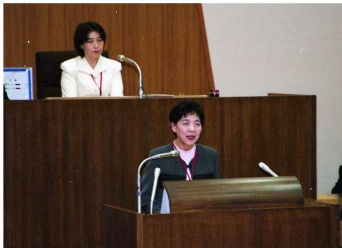
鳥取市女性議会を開催