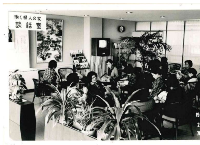
談話室での楽しいひと時（昭和51年2月）