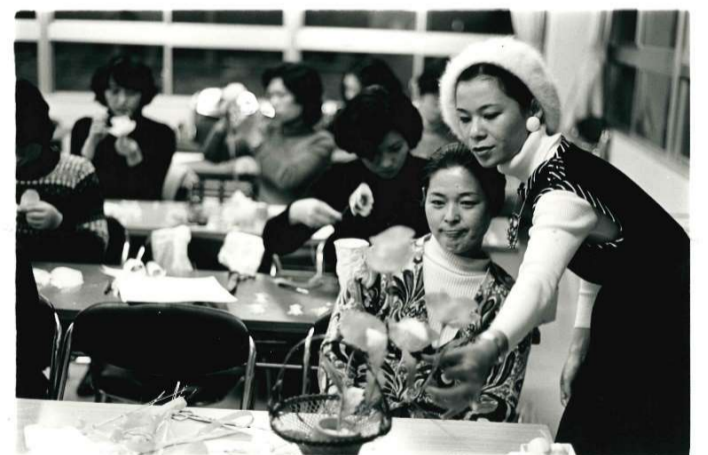
フラワーデザイン・テーブルコレクション講座（昭和51年12月）