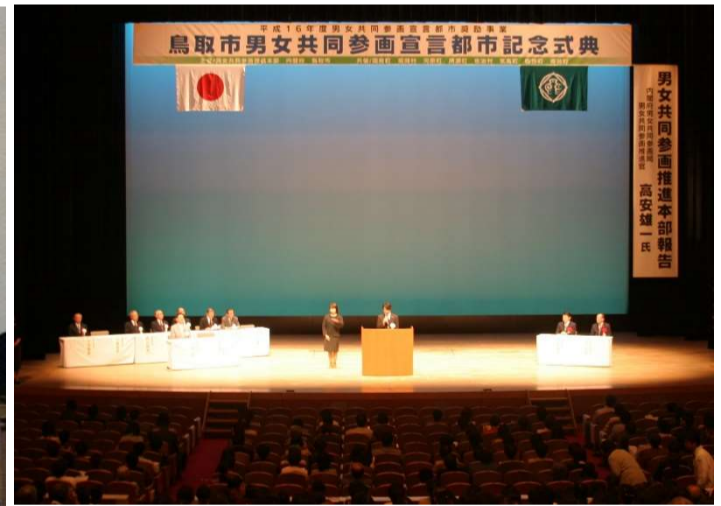
鳥取市男女共同参画宣言都市記念式典