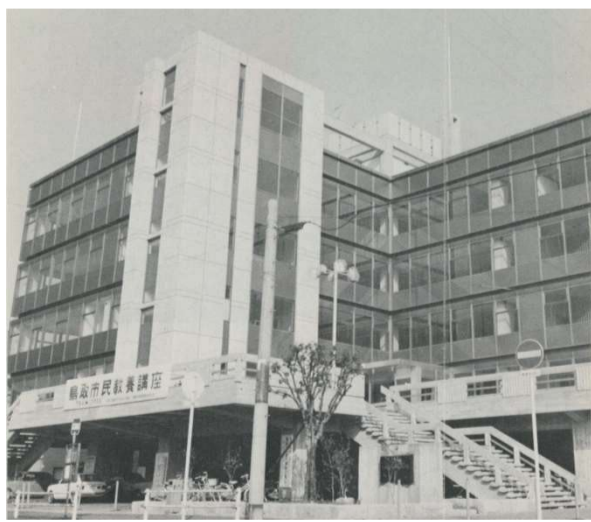
竣工当時の「鳥取市福祉文化会館」