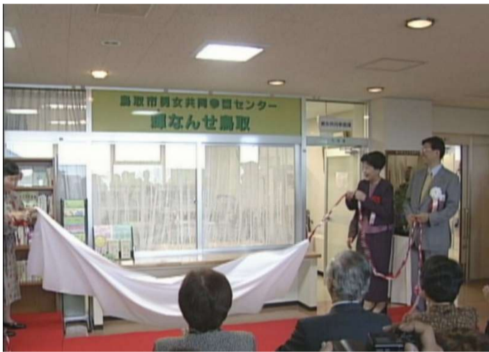
センター開設除幕式