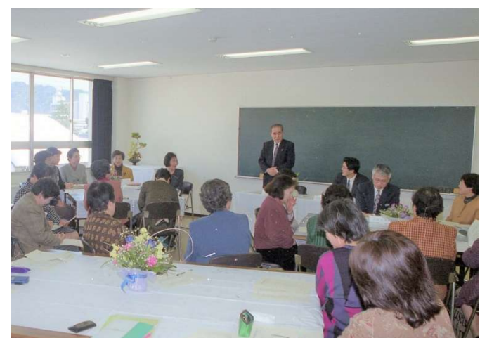
西尾市長と広域女性交流室連絡会との懇談会