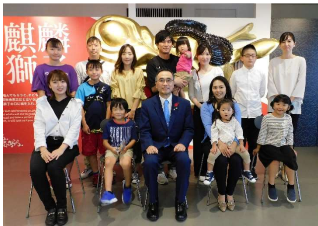
深澤市長と男女共同参画70プロジェクト受賞者との記念撮影