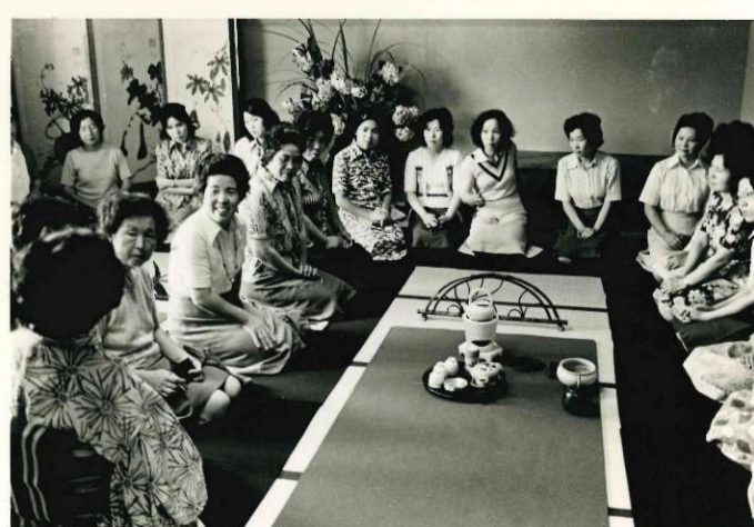
煎茶と日用茶の正しい入れ方講座（昭和51年6月）