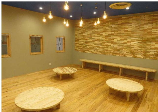
ぬくもりのある“木”を基調とした託児スペース