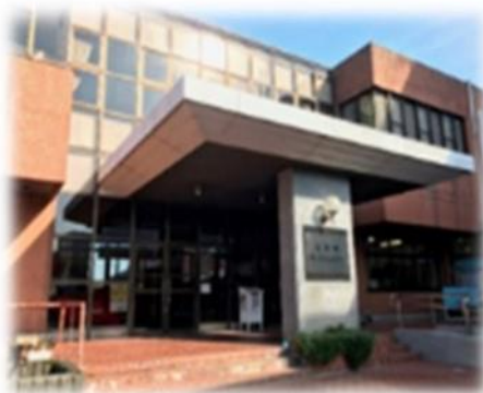
文化施設利用料補てん額