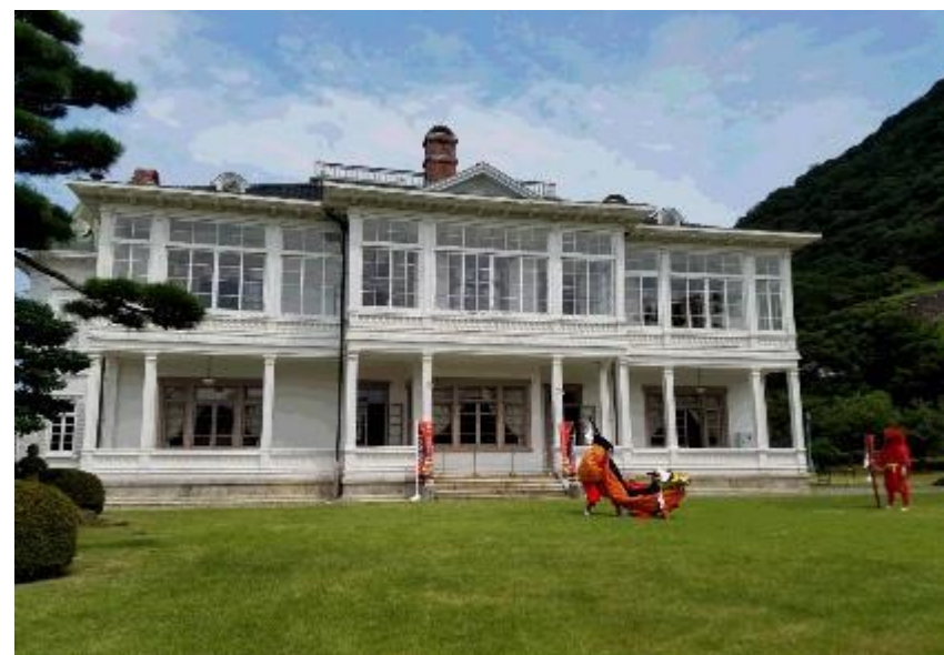
麒麟獅子舞体験体感プログラム