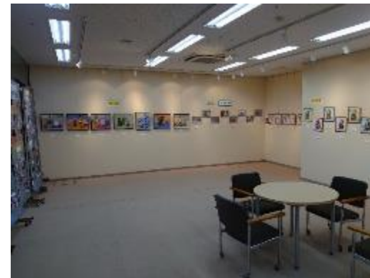
出前講座 作品展 @文化センター