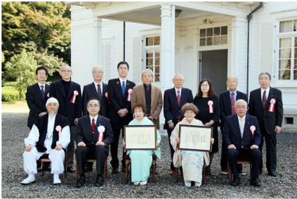
令和3年度 第46回 鳥取市文化賞贈呈式 令和3年11月3日 / 仁風閣