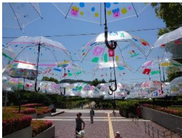
アンブレラスカイ (小学生が制作した 200本のビニール 傘を空中に展示)