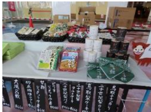
釧路商業高校 販売実習会 鳥取市物産を紹介