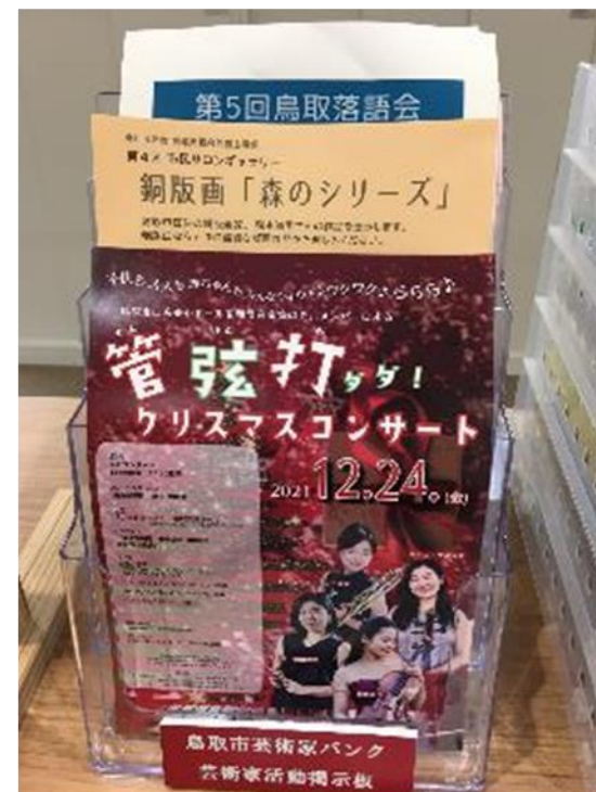
活動掲示板 （市役所窓口、鳥取市HP）