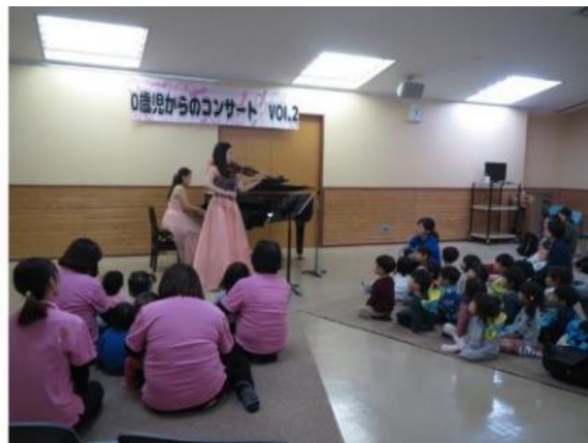
乳幼児向けコンサート