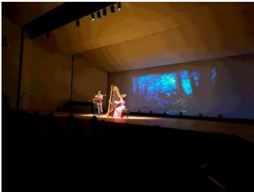
ヴァイオリンとハープデュオX【iksa】