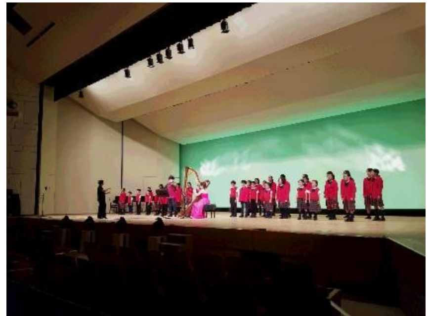
フィナーレX【iksa】と鳥取市少年少女合唱団