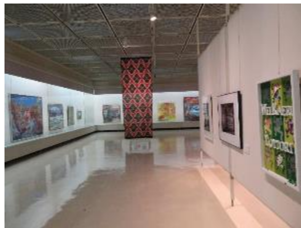
審査員作品展 (第50回～第60回 審査員作品)