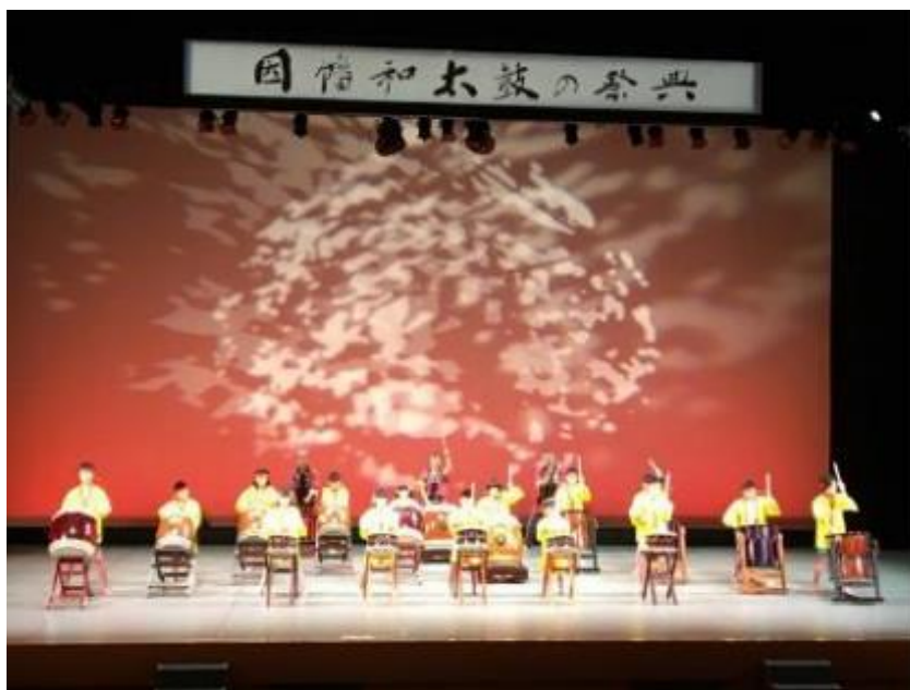
和太鼓ワークショップ(発表会)