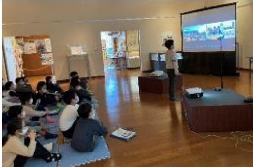
郡山市との和紙交流事業 (オンライン)