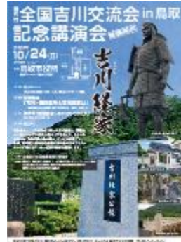
全国吉川交流会 in鳥取