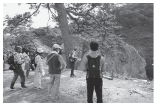
ジオパークガイドのツアー

地域活性化と一口に言っても、アプローチの方法は多岐にわたります。ここ山陰海岸ユネスコ世界ジオパークでも、エリア内の各地で定期的なジオサイトの点検、海岸や山林の清掃、ふるさと学習やジオ視点での防災学習、観光アクティビティやガイド、そして地元食材グルメの開発などさまざまな活動があり、そこには多くの人に関わってくださっています。