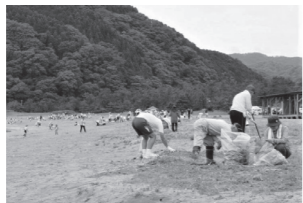
地元中学校による清掃活動

ジオパークの目的は大きく3つ。①保護、②教育、そして③活用です。簡単に言うと、価値ある地質遺産を守り・知り・使って「ここに住みたい」「ここに住み続けたい」と思えるような持続可能な地域づくりをしようという地域活性化の事です。