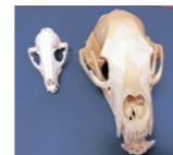
キツネ(左)とツキノワグマ(右)の頭蓋骨(個人蔵)