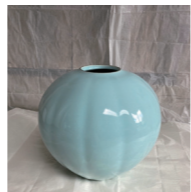
坂本章さん作 青瓷壺

～鳥取県の指定文化財～ 令和4年度に新規指定された鳥取県指定文化財を紹介。 とき 12月2日(土)～ 令和6年1月14日(日) 観覧料 無料