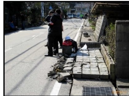
地震で倒壊したブロック塀