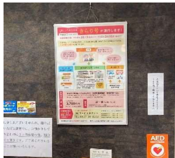
◀ 施設等でのポスター掲出（道の駅西いなば）