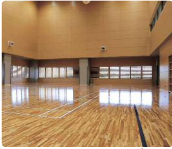
広さ：368㎡(バレーボールコート1面分) ※公式試合での使用は不可

災害時の避難所としても 体育館の近くには、過去に水害が発生したことがある大路川があることから、メインアリーナなどの主要施設を浸水しない2階部分に設けました。そのほかにも、国道53号線から直接施設へ出入りできるスロープや防災備蓄倉庫を設け、災害時に避難所として活用できる施設としています。