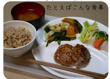
たとえばこんな食事