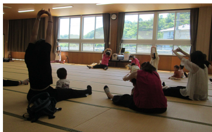
6/7(金) 親子ふれあい教室