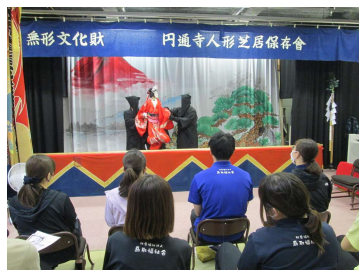
6/12(水) 人権と福祉のまちづくり講座