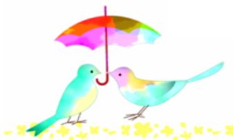
鳥取市人権施策基本方針第3次改訂より 引用、抜粋

遺族等の苦しい思いが社会に正しく理解され、地域での孤立を防ぐような配慮が求められます。