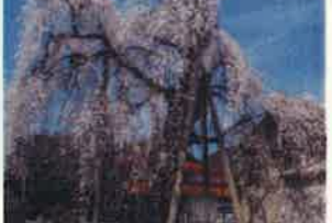
DATA MAP A-1

日通り周囲2.45m、樹高15 m、枝張り東西15m、南北8.5 mの本主枝から細い枝が傘のように 垂れ下がって見事。昭和30年9 月6日県指定文化財。