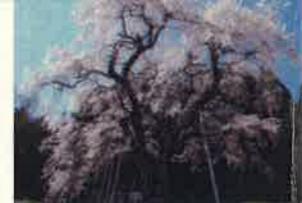
DATA MAP A-1

三谷神社の参道に大きく広が るこのしだれ桜は日通り2.47 m、樹高12.5m、枝張り東西1 8.2m、南北20.2mある。樹勢 は至って良好であり、枯損した枝 等は見えな。3本の主枝から細 い枝はしだれ、満開の時は見事で 美しく、地方的に有数の巨木であ る。樹齡約280年。昭和55年 10月1日町(当時)指定文化財。