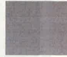
DATA MAP A-1