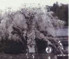
DATA MAP A-1

日通り周囲2.2km、樹高12 m、枝張り東西20m、南北16m に広がってたれ下がり、花は五重 の淡紅白色で葉に先立って4月上 旬に花開く。鳥が羽根を広げた ような樹形でその樹齡は約400 年といわれている。昭和31年6 月5日県指定文化財。