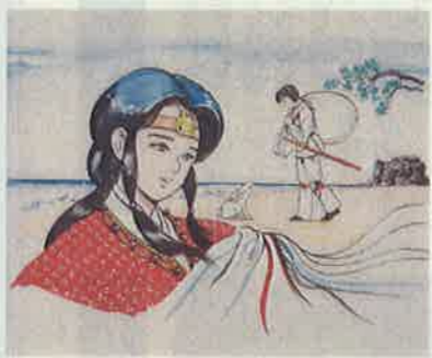
(イラスト:河原町出身漫画家 藤原芳秀)

はるか古代ー因幡国ひなほのくに八上の郷(河原町)に美しい八上姫が住んでいることを伝えた八十神たち(大國主命の兄弟)は、八上姫をめぐると大國主命を伴い出雲の国から八上の郷へ向かいました。途中の海岸で大國主命は、サメに毛をむしられ、そのうえ八十神たちにもまされて泣いていた白ウサギを助けてやりました。白ウサギは、大國主命と八上姫が結ばれることを予言し、それが中。大國主命と八上姫は永遠の契りを結びました。