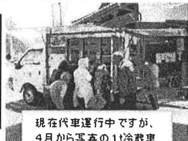
現在代車運行中ですが、4月から写真の1台冷蔵車でお伺いできる予定です。

平成29年度から、移動販売に加えて昼間独居高齢者や昼間高齢者のみとなる世帯に対する見守り活動の拡大支援を実施します。