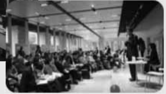
写真：千代田区 多目的スペース