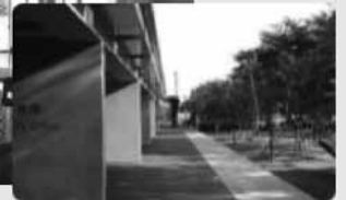
写真：立川市 庁舎周辺の緑化