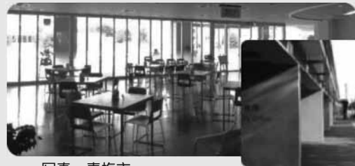
写真：青梅市 市民交流スペース