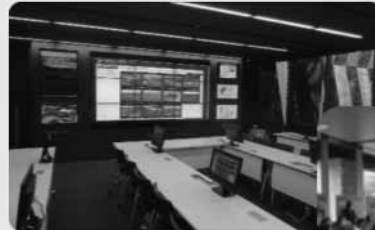
写真：長岡市 災害対策本部会議室