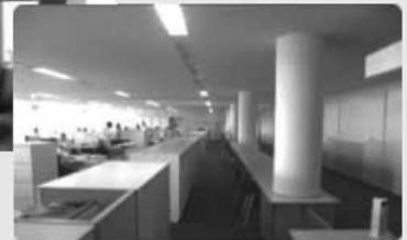
写真：青梅市 事務空間