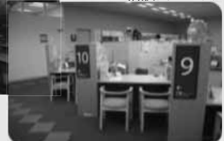
写真：千代田区 相談スペース