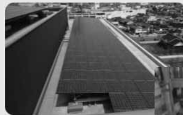
写真：出雲市 太陽光発電

自然エネルギーの活用、エネルギーの有効利用、エネルギー負荷の低減など、環境との共生が図れる庁舎とします。