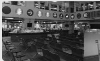
写真：松山市 窓口スペース、案内表示

ユニバーサルデザイン：すべての人が暮らしやすいように、まちづくり、ものづくり、環境づくりなどを行っていこうとする考え方。