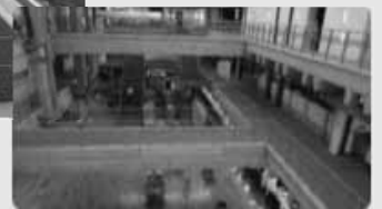
写真：立川市 高強度の構造

日本一と言われるような防災庁舎を 鳥取市を象徴し、愛着の持てるデザイン 市民が利用できる食堂の設置を 市民が憩える多目的スペースを 市のPRスペースをつくり、イベントや行事をアピール 平面であるなど、使いやすい駐車場 IT（情報技術）化に対応した庁舎 省エネ、自然エネルギー採用で環境に優しく 高齢者、障がい者まで使いやすい庁舎 など