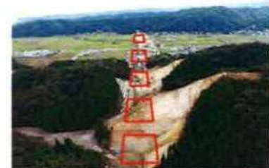
写② 浜村産野温泉IC付近(鳥取市産野町乙亥正地内)