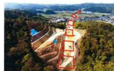
写① 吉岡温泉IC付近(鳥取市松原地内)