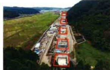
写③ 青谷IC付近(鳥取市気高町青谷地内)