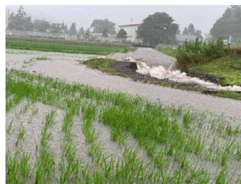
R3.7.7 勝谷川 宮方から上流