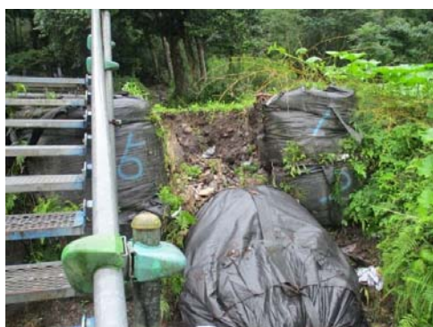
岡井集落 R3.7.7 被害現況