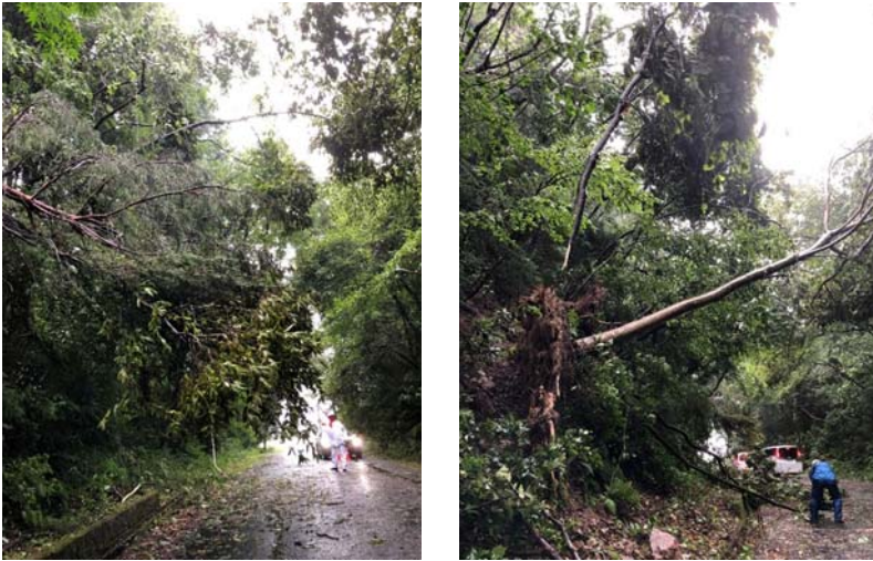
R3.8.9 市道今町下石線倒木 被害状況