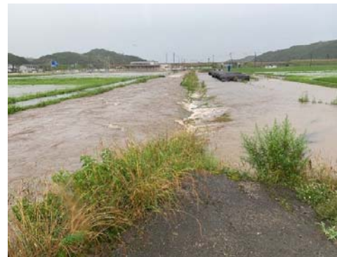
R3.7.7 浜村川 岡井から下流