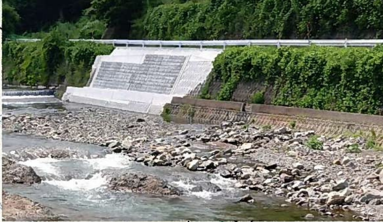
国道482号 R5災395号(佐治町畑地内)