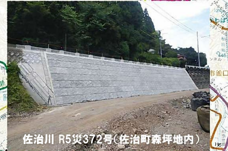
佐治川 R5災372号(佐治町森坪地内)